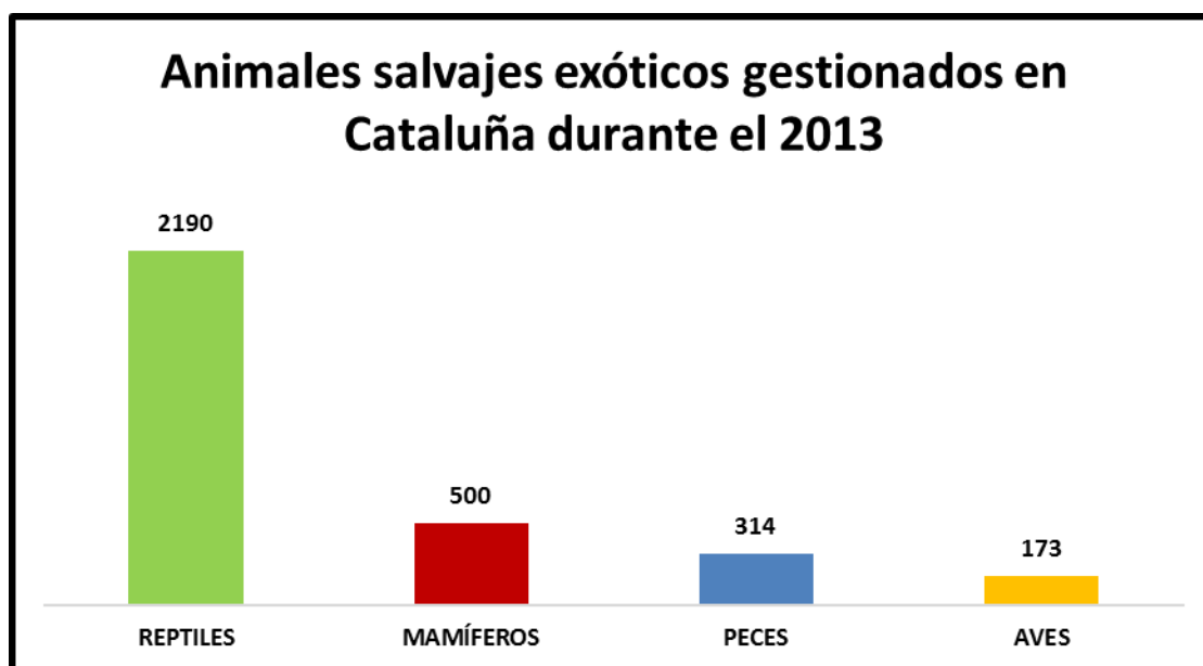
Gráfico: Durante 2013 el número total de animales salvajes exóticos gestionados fue: 3.177 individuos: 2.190 reptiles; 500 mamíferos; 314 peces; y 173 aves.