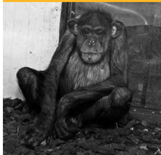
Yvan después de su llegada a Rainfer.