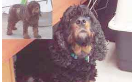
La perrita Mia una vez rescatada de las aguas fecales de una cloaca en Barcelona (20/12/09)

Durante el año 2009, la fundación ha gestionado el rescate de dos ejemplares de yaco, dos ejemplares de chimpancé decomisados del Circo Quirós, un ejemplar de Saimiri, dos ejemplares de Macaco y dos ejemplares de petauro de azúcar.