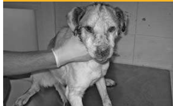
El pobre perro estaba en muy mal estado, ahora está felizmente adoptado (23/02/09)