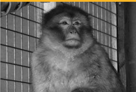
Después de ser rescatada (diciembre. 09).