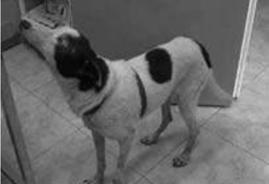
Llago, hoy felizmente adoptado (21/08/09)

● Milagro, macho de pastor alemán víctima de los cazadores. El perro llevaba cuarenta y nueve perdigones y dos balines en su cuerpo aún con vida cuando lo rescatamos. El día de su rescate, el 18 de junio de 2009, comprobamos que estaba gravemente herido y enfermo además de presentar un pronunciado estado de caquexia.