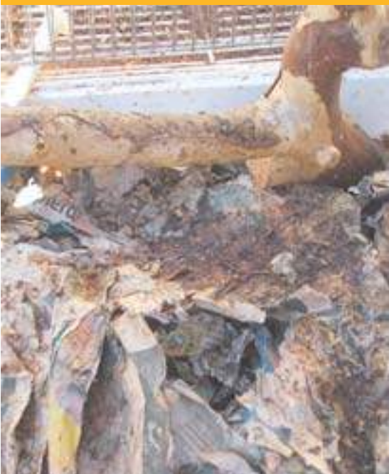
Jaula con basura donde vivía el petauro.

El área de fauna exótica y salvaje ha registrado y denunciado diversos casos de animales salvajes tales como chimpancés, loros yacos, mono patas, monos Gibbon, un ejemplar de babuino, titís pincel blanco y negro, leones, tigres, ardillas coreanas y tortugas terrestres que precisan ser retirados de sus propietarios pero lo único que ha conseguido es decomisarlos in situ, pues la autoridad competente no tiene un lugar donde poderlos ubicar de forma digna.