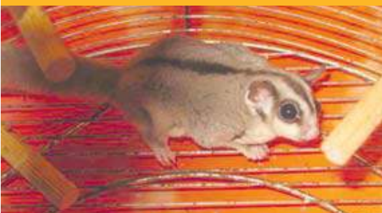
Hembra de petauro rescatada (diciembre 2009).