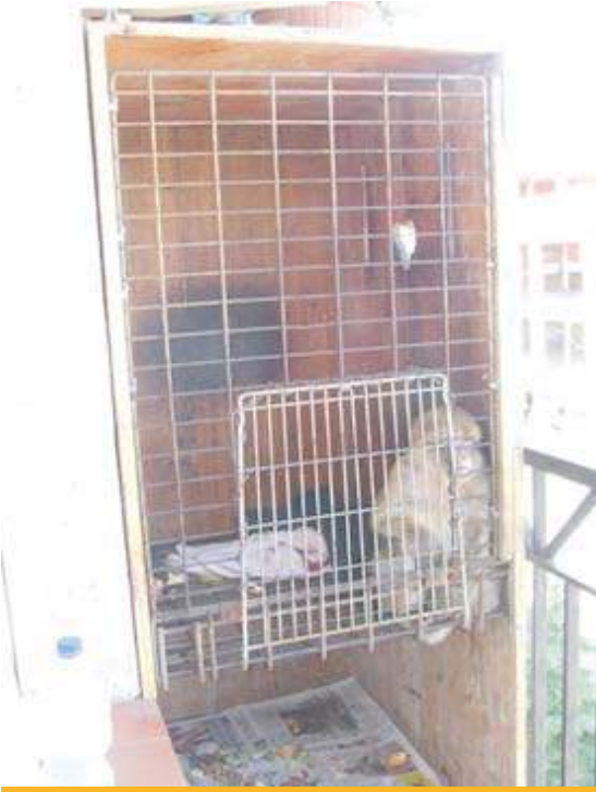
La macaca vivía encerrada en una jaula improvisada en el balcón.