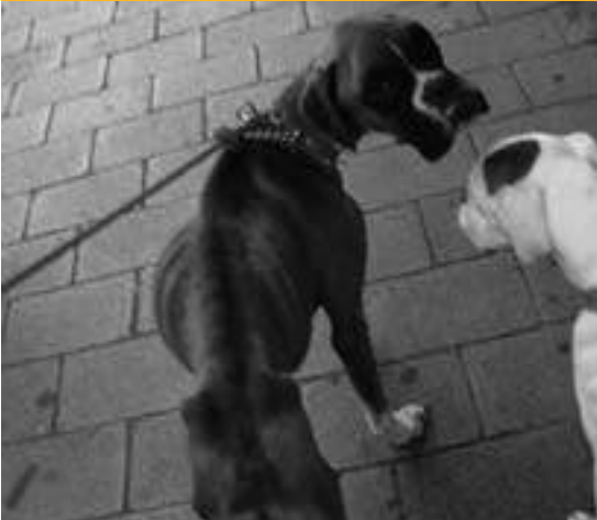
Los dos boxers presentaban un avanzado estado de desnutrición (25/11/09)