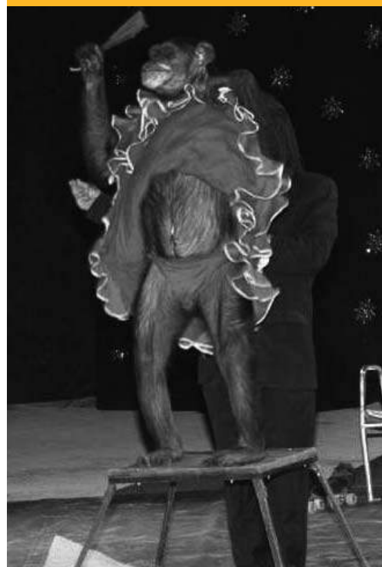
En una de sus actuaciones con el circo.