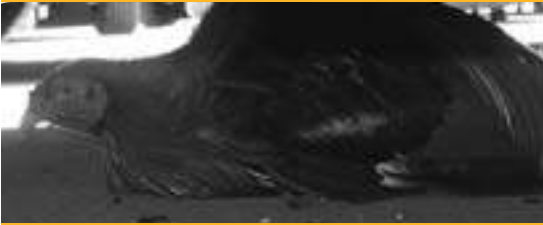
Gallo debajo de coche (08/07/09)