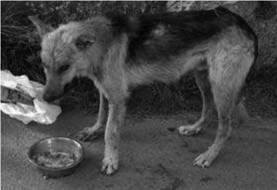
Milagro antes de ser rescatado (18/06/09).