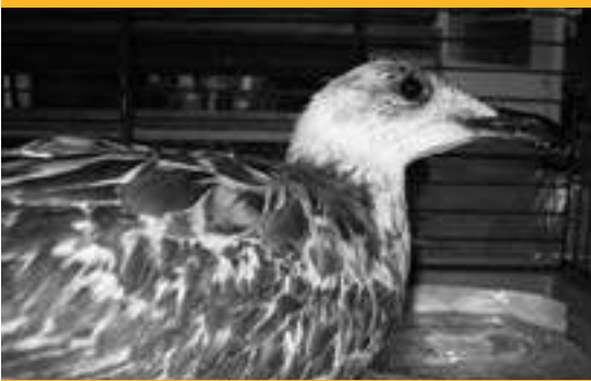
Gaviota antes de ser liberada (17/09/09)